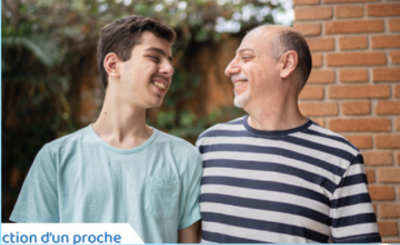
ction d'un proche